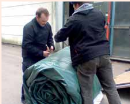
7. Lopuksi kiinnitä liinat paketin ympäri.