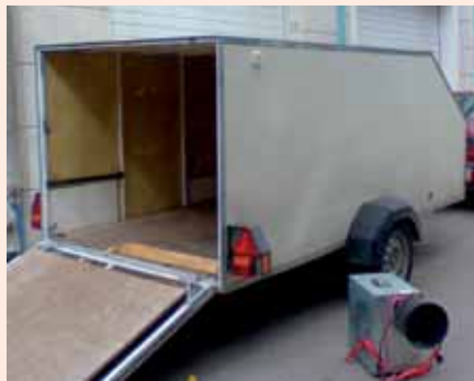
8. Kieritä kuljetuskalustoon.