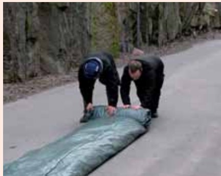
5. Pyöritä toimintarata siististi pakettiin samalla tyhjentäen ilmoja patjasta.