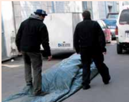
4. Tallo ilma pois patjasta.