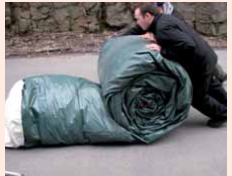
6. Toimintarata lähes paketissa.