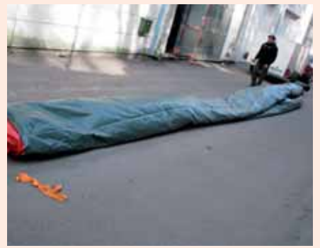
3. Käännä rata vielä kertaalleen päällekkäin.