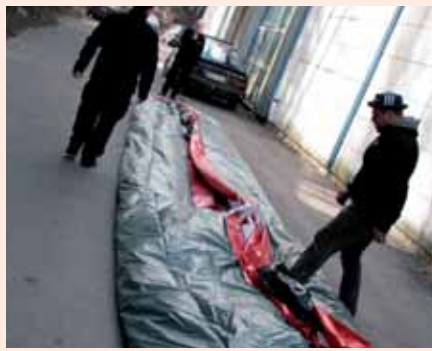
2. Käännä oikea ja vasenlaita keskitetysti keskelle. Tallo ilmat pois.