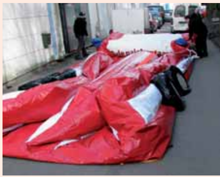
1. Irrota puhallin ja anna radan tyhjentyä itselleen.